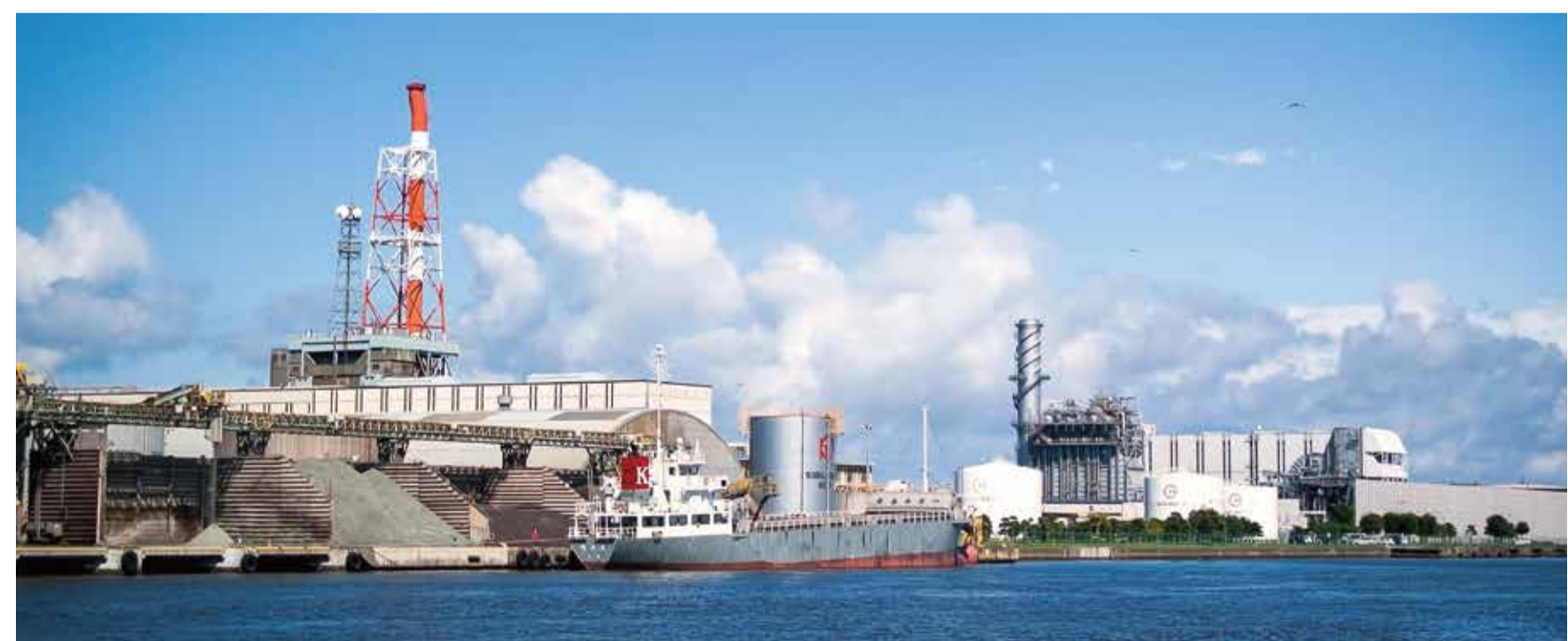
液体水素払出および輸送 Transporting Liquid hydrogen