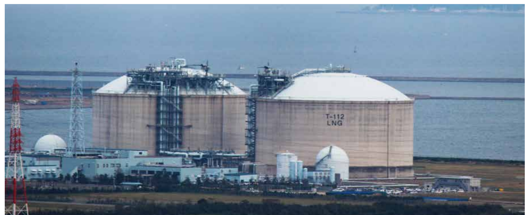
液体水素受入基地 Liquid hydrogen receiving terminal

(※)上記写真はイメージです。 The above photos are for reference.